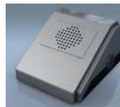
Module acoustique MA-1