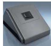
Module de commutation : pour le branchement d'appareils électriques externes