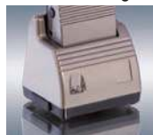
Station de charge pour radiorécepteur portable « signolux »